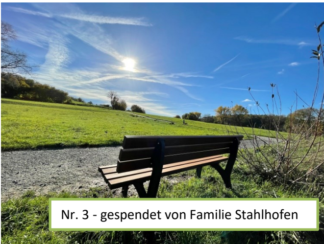
Nr. 3 - gespendet von Familie Stahlhofen