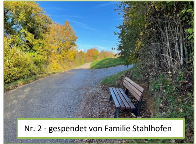
Nr. 2 - gespendet von Familie Stahlhofen