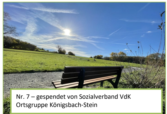
Nr. 7 – gespendet von Sozialverband VdK Ortsgruppe Königsbach-Stein