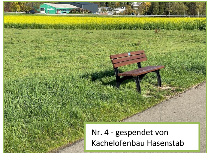
Nr. 4 - gespendet von Kachelofenbau Hasenstab