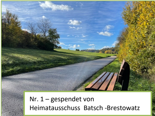
Nr. 1 – gespendet von Heimatausschuss Batsch -Brestowatz